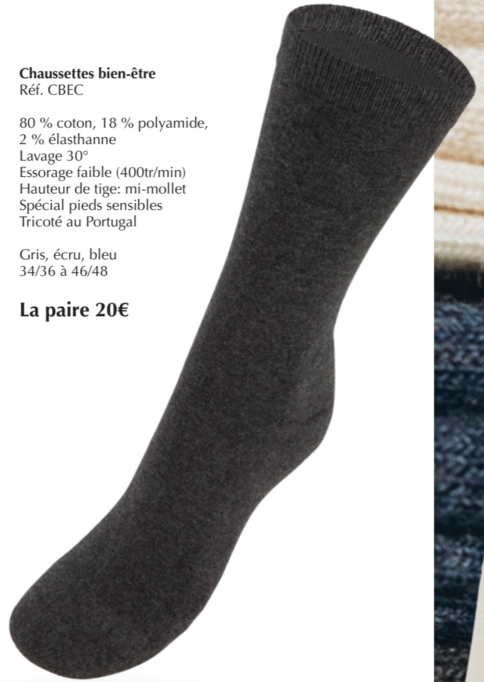
Chaussettes bien-être Réf. CBEC

80 % coton, 18 % polyamide, 2 % élasthanne Lavage 30° Essorage faible (400tr/min) Hauteur de tige: mi-mollet Spécial pieds sensibles Tricoté au Portugal