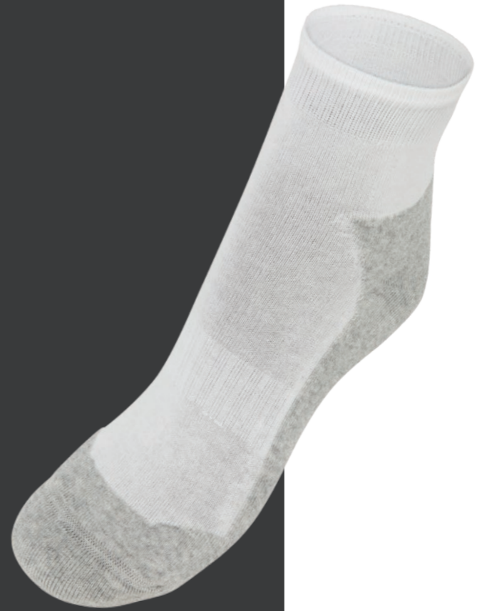
Socquettes de loisirs Réf. CSPO

85 % coton ,11 % polyamide 4 % élasthanne Lavage 30° Essorage faible (400tr/min) Hauteur de tige : dessus cheville Maille bouclée amortissante. Douces et légères. Idéales pour la marche et les loisirs. Tricoté en Portugal